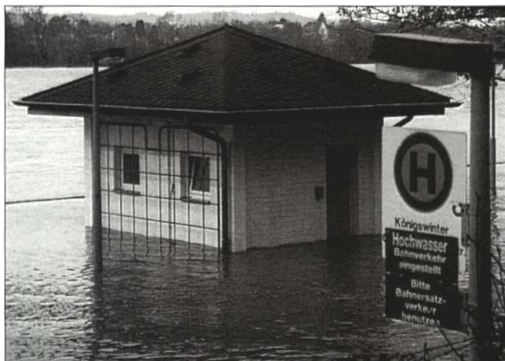
In Mitteleuropa werden sich die Menschen noch mehr als bisher schon auf Hochwasserlagen einstellen müssen.

gienischen) Bedingungen und einer verstärkten Ausbreitung tropischer Krankheiten wie Malaria, Denguefieber, Hirnhautentzündung, Cholera und Durchfallerkrankungen zu rechnen 6,7 . Durch Auslandsreisen und Zuwanderung besteht für Deutschland ein steigendes Einschleppungsrisiko. Als Überträger dieser Krankheiten sind aber auch thermophile Insekten denkbar, die sich von Süden kommend ausbreiten. Eine Verbreitung von eingeschleppten Krankheiten durch heimische, insbesondere blutsaugende, Insekten ist ebenfalls möglich. Nach einem Bericht der Zeitung „Die Welt“ vom 13.9.1999 hat die Weltgesundheitsorganisation (WHO) bereits eine Sondereinheit eingerichtet, deren Aufgabe es ist, die Ausbreitung der Malaria und anderer tropischer Krankheiten zu überwachen. Die Zeitung zitiert britische Wissenschaftler, die eine Ausbreitung der Malaria in Spanien schon bald für möglich halten.